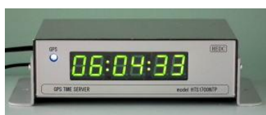
フロア固定アダプタ付